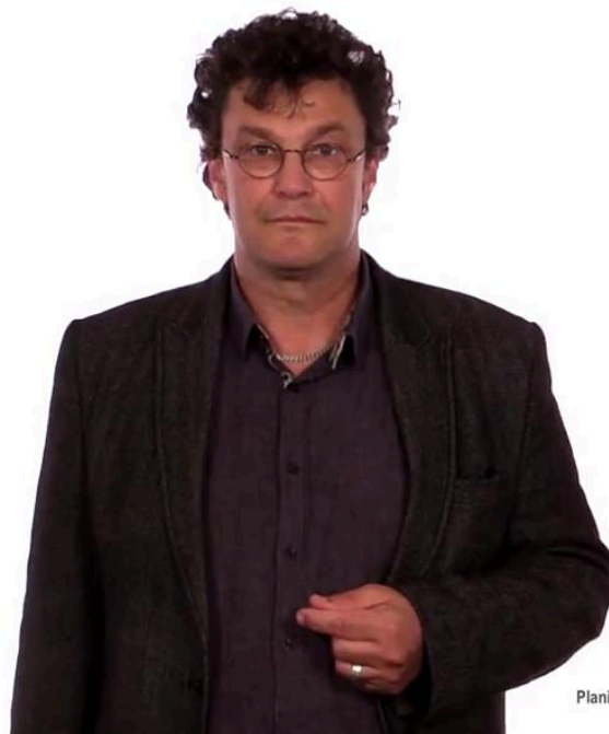
Planification des mobilités

L'excursionnisme. Il s'agit de l'ensemble des voyages d'une journée, voire d'un week-end. L'excursionnisme concerne en particulier le tourisme urbain, comme passer un week-end dans une ville pour aller voir une exposition ou la visiter, mais il concerne également souvent les loisirs dans la nature, comme par exemple les courses de montagne.