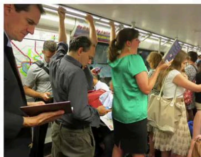
Planification des mobilités

→ Elle peut être quotidienne ou hebdomadaire