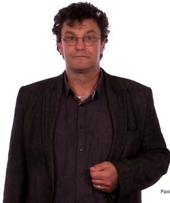
Planification des mobilités

On parle de mobilité virtuelle pour qualifier la communication à distance impliquant la présence en direct des personnes. Il s'agit donc, notamment, du téléphone, des vidéoconférences, et des chat rooms, par exemple.