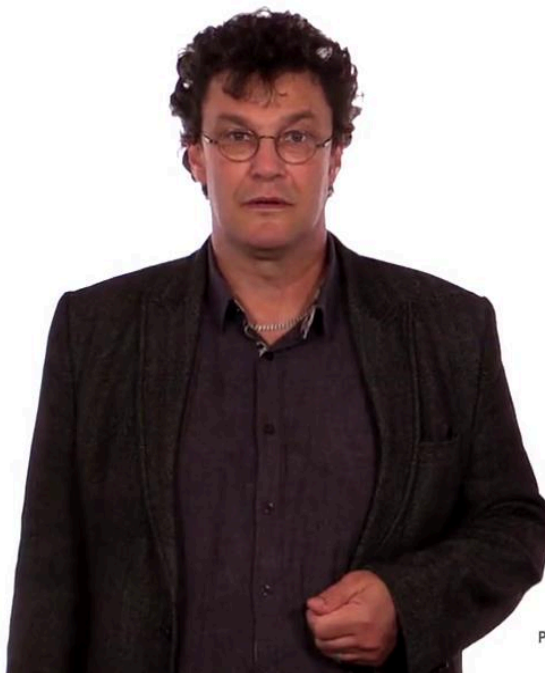
Planification des mobilités

La mobilité résidentielle. Il s'agit des déménagements dans une même région. Les déménagements sont généralement en lien avec le parcours de vie et les événements qui le jalonnent.